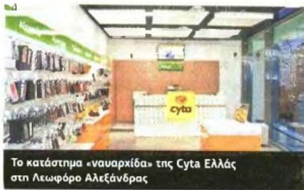
Το κατάστημα «ναυαρχίδα» της Cytac Ελλάς στη Λεωφόρο Αλεξάνδρας

Ο κλάδος των τηλεπικοινωνιών στην Ελλάδα βρίσκεται σε φάση συγκέντρωσης. Παράλληλα, πολλά θα καθοριστούν για την εταιρία από τις εξελίξεις στην μητρική στην Κύπρο. Πώς βλέπετε το μέλλον; Είναι λογικό, σε έναν δυναμικό κλάδο όπως ο δικός μας να παρατηρείται κινητικότητα. Παρακολουθούμε με πολλή προσοχή όσα συμβαίνουν.